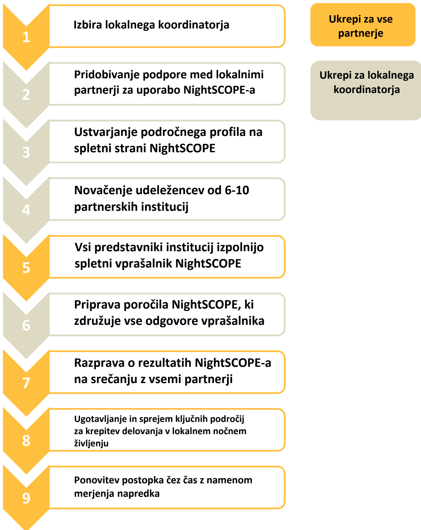
Slika 1: Ključni koraki pri uporabi NightSCOPE-a